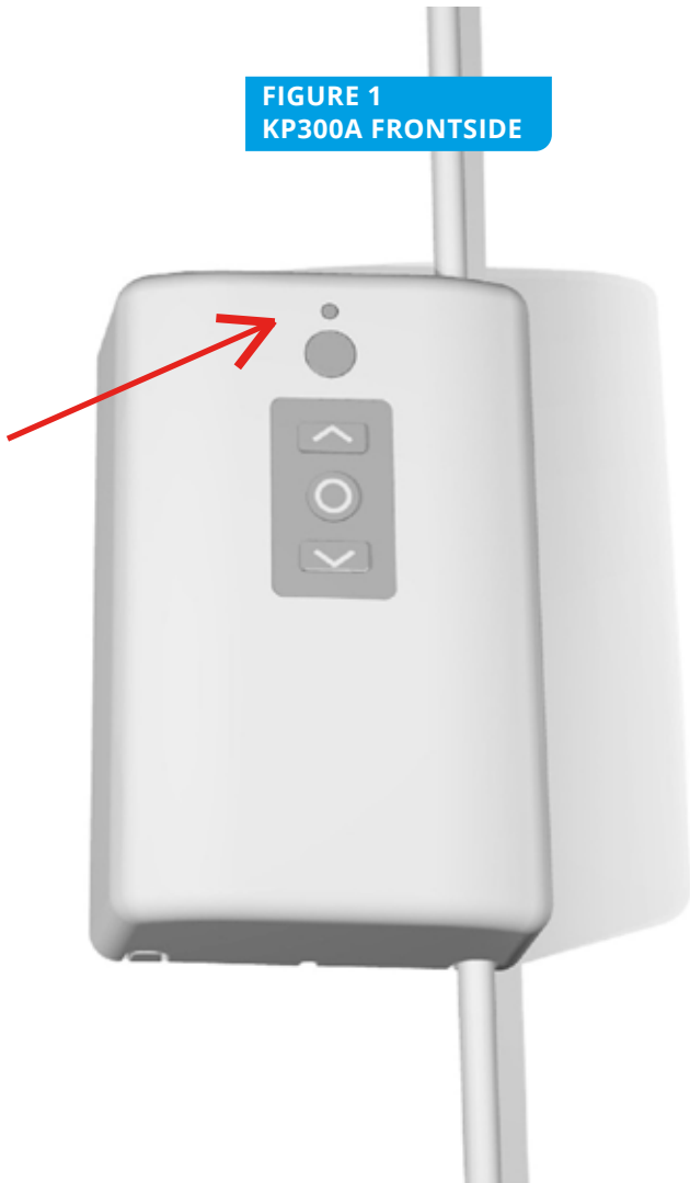
FIGURE 1 KP300A FRONTSIDE